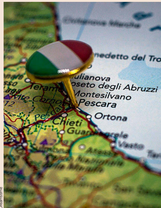
La regi n de Abruzzo cuenta con 1,3 millones de habitantes.

En el plano econ mico, la regi n de Abruzzo con aproximadamente 1,3 millones de habitantes, cuenta con un sistema en el que el turismo es uno de los principales motores, junto con sectores como el agroalimentario y la industria. Entre las cadenas de producci n manufacturera destacan la automoci n, la mec nica y la farmac utica, que contribuyen de manera significativa a las exportaciones regionales. En 2024, las exportaciones de Abruzzo se situaron en unos 9.500 millones de euros, de las que Espa a absorbe un 4% –convirti ndose en el cuarto destino que m s compra a esta regi n–.